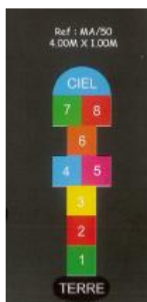
Jeu simple plein