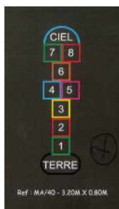
Jeu simple non plein